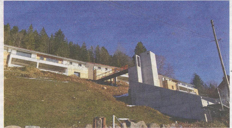
Une tour coiffée d'une passerelle a surgi juste au-dessus d'une maison classée remarquable dans le SPR

Ce qui est envisagé est incroyable mais vrai. Partout les promoteurs sont à l'affût. Le PLU est en cours de modification et une procédure de révision est engagée. Les règles d'urbanisme risquent donc de changer et la stratégie de ceux qui ne recherchent que le gain financier immédiat est de figer la situation actuelle qui leur est favorable. Quelques propriétaires avides cèdent à prix fort leur bien aux promoteurs, qui cherchent à faire fructifier facilement. C'est le bon moment, car demain ce sera peut-être trop tard ! Pour éviter toute déconvenue : un Certi-