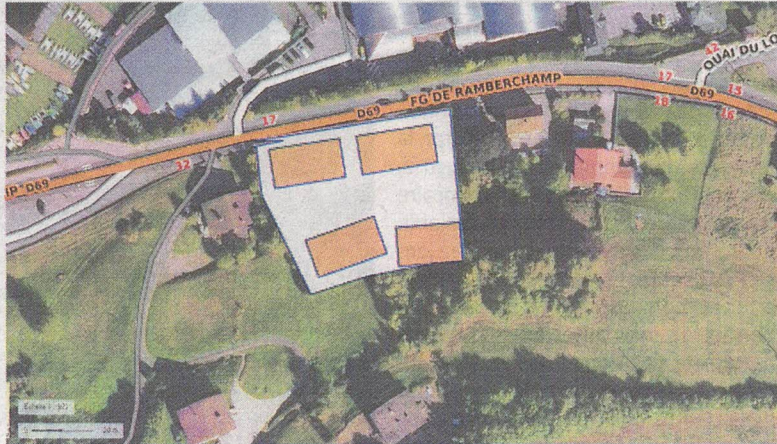
Un projet de 33 logements sur 4 000 m2 au bord du lac !